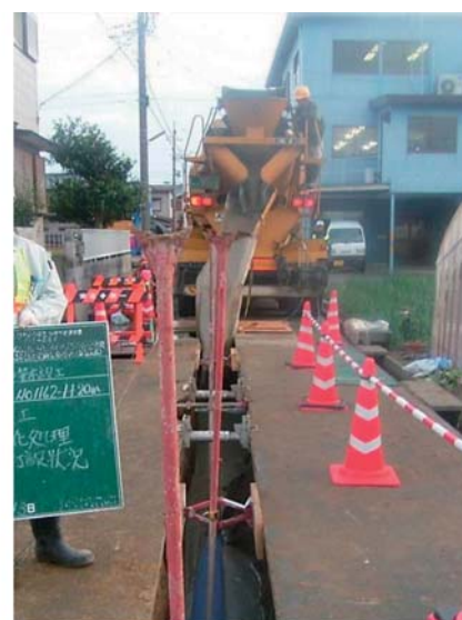
写真：流動化処理土打設状況