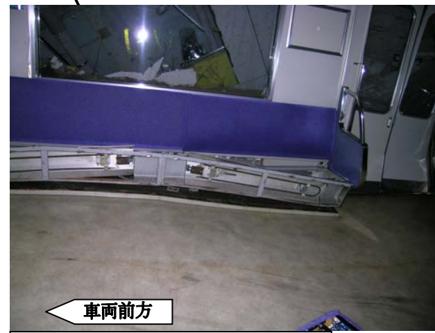
車体中間部の状況（室内右側）