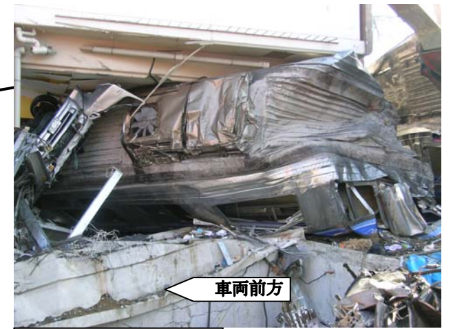
車体後部の損傷状況 （復旧作業中）