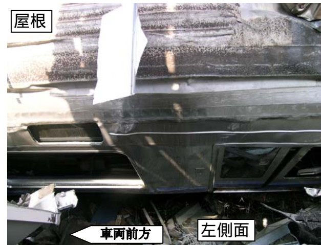
車体中間部の状況