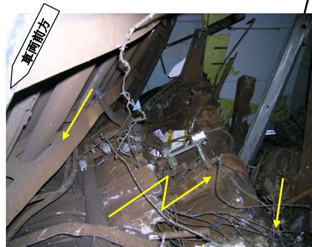
台わく・床の折れ曲がり状況