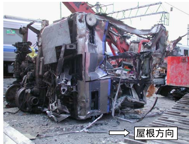
先頭部の損傷状況 （復旧作業中）