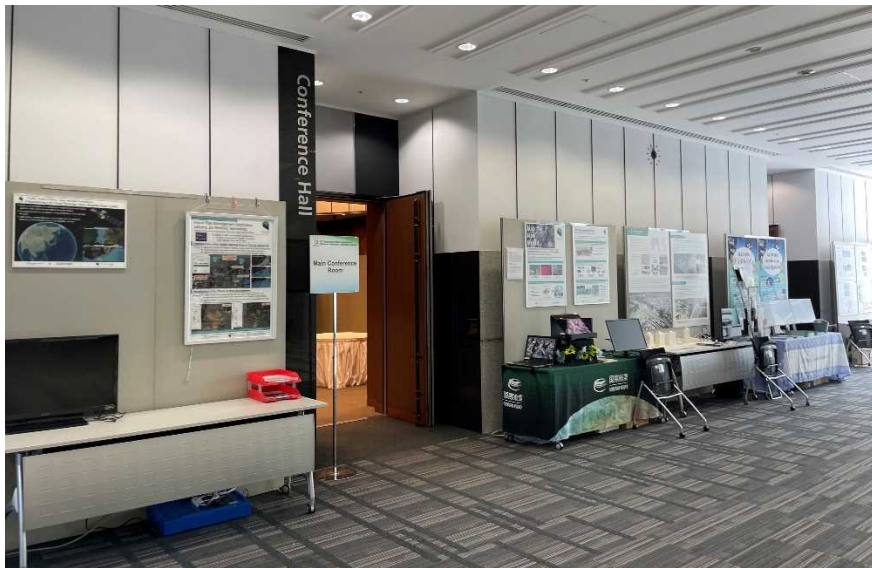
展示ブースの様子