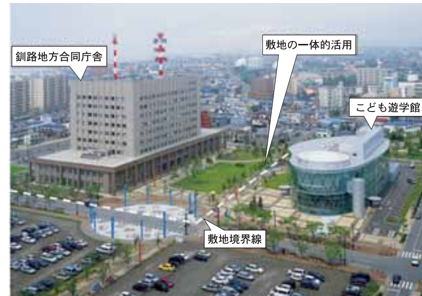
地区内の完成施設