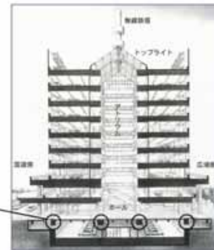
釧路地方合同庁舎断面図