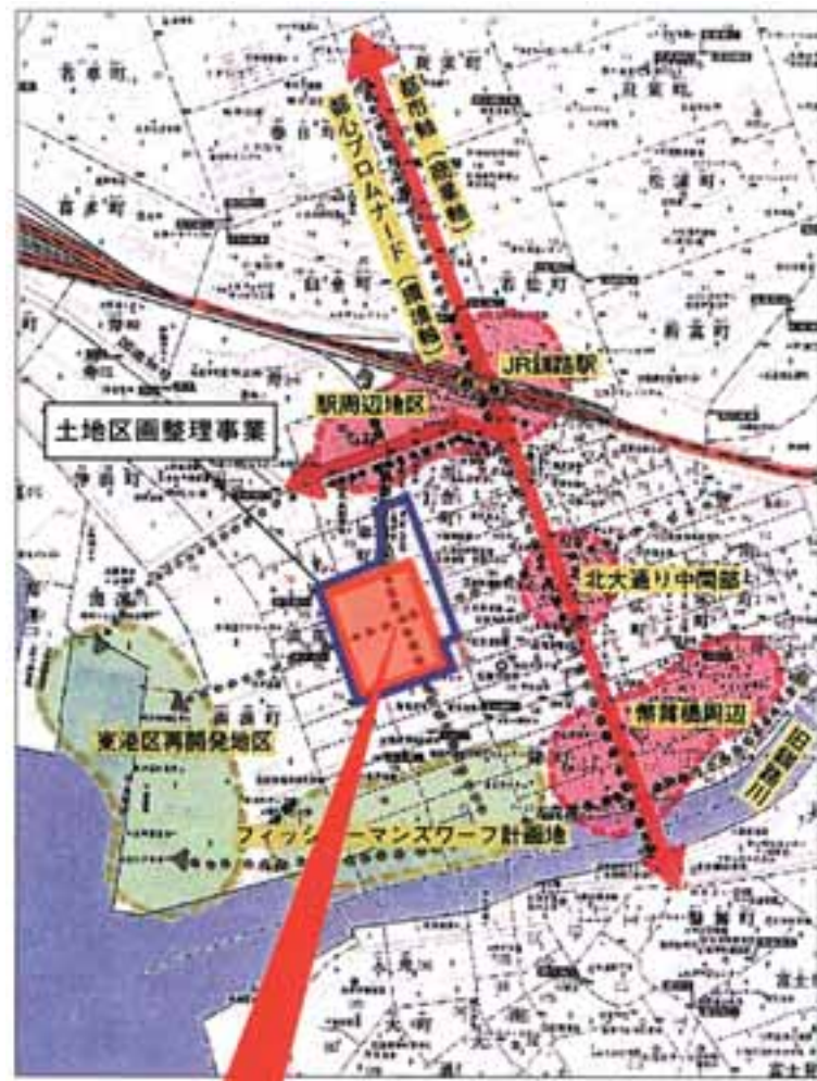
シビックコア地区の位置