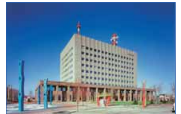
釧路地方合同庁舎と中央広場