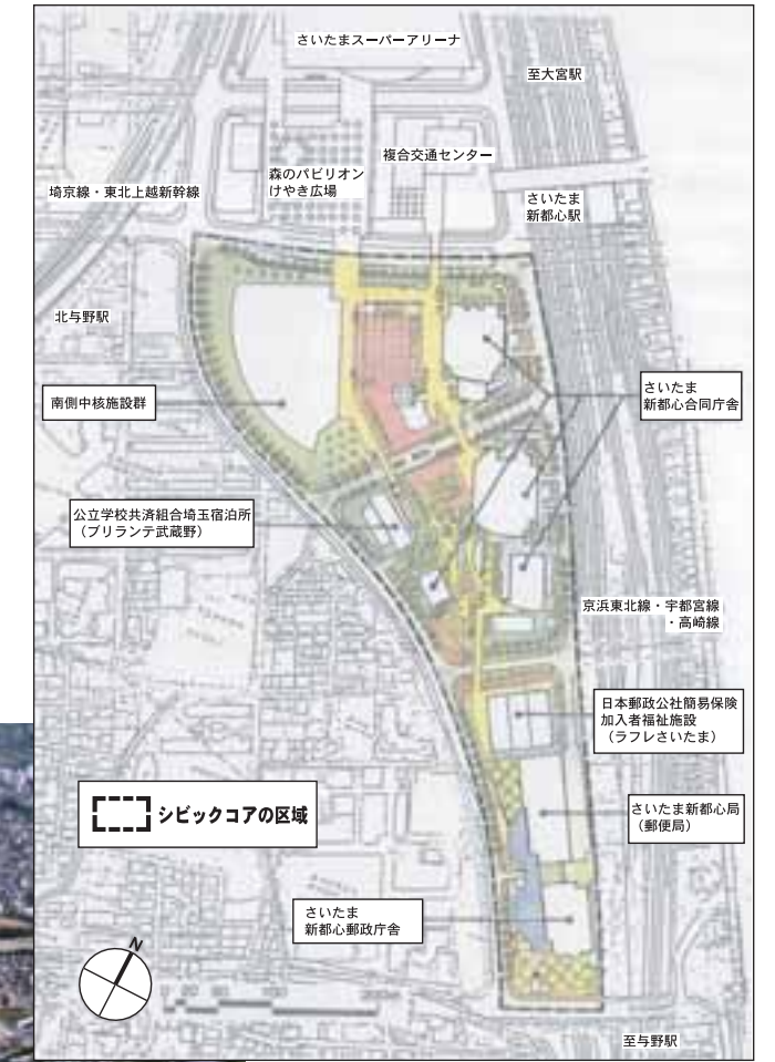
地区全体の配置図