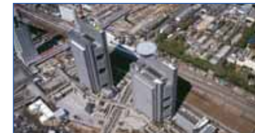
さいたま新都心合同庁舎の航空写真