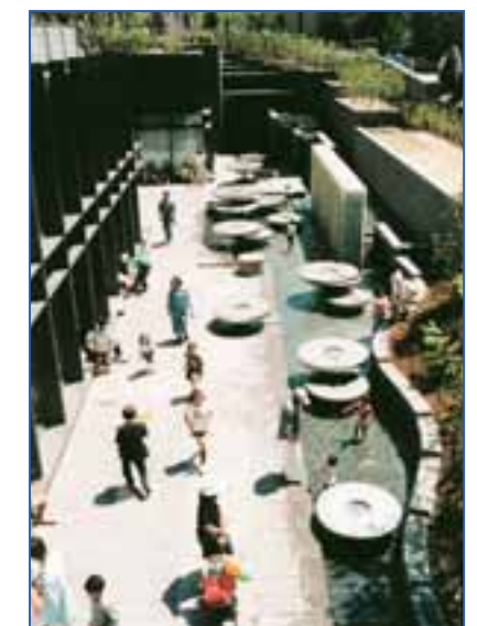
さいたま新都心合同庁舎周辺の様子