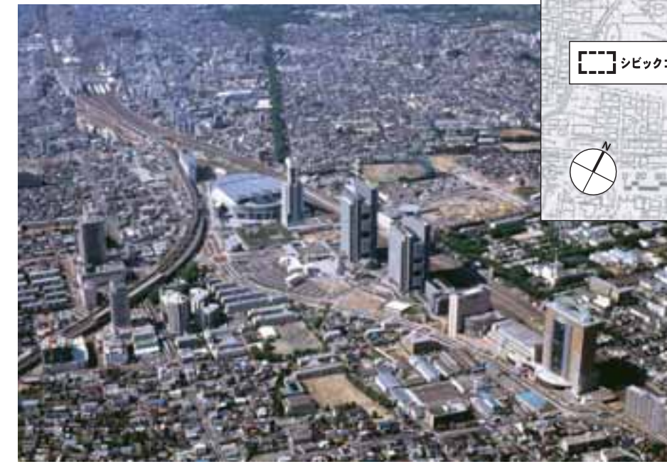
地区全体の航空写真