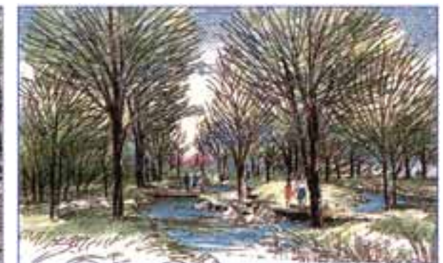
ビオトープイメージパース