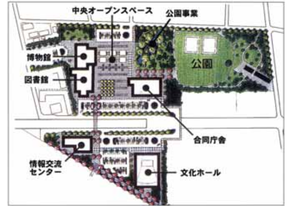
地区全体の配置図