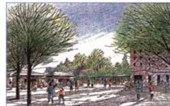
多目的広場のパース