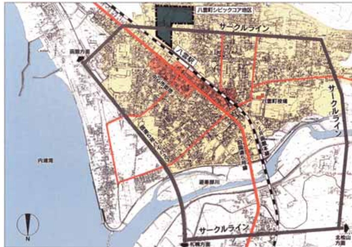
シビックコア地区の位置