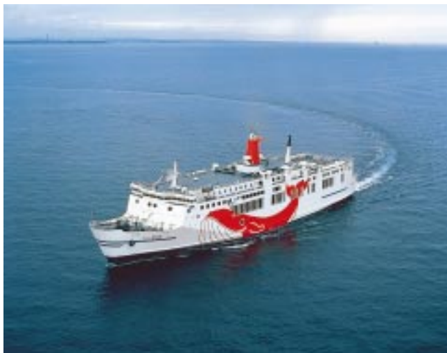
旅客と自動車を同時に輸送するフェリー (土佐清水、高知、大阪をむすぶフェリー「むろと」)