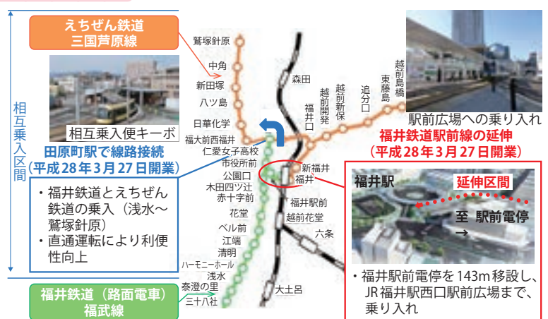
図表 II-5-3-2 相互乗入・駅前広場乗入の整備（福井市）

少子高齢化に対応した交通弱者のモビリティの確保を図るとともに、都市内交通の円滑化、環境負荷の軽減、中心市街地の活性化の観点から公共交通機関への利用転換を促進するため、LRT等の整備を推進している。平成28年3月に福井市において、路面電車の駅前広場乗り入れと鉄道との相互乗り入れが実現したほか、各都市において、路面電車のバリアフリー化が進められるなど、公共交通ネットワークの再構築等が進められている。