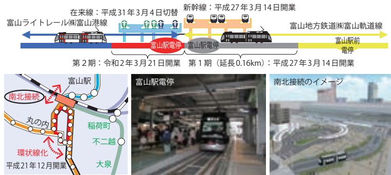
図表II-5-3-2 路面電車南北接続事業（富山市）

少子高齢化に対応した交通弱者のモビリティの確保を図るとともに、都市内交通の円滑化、環境負荷の軽減、中心市街地の活性化の観点から公共交通機関への利用転換を促進するため、LRT等の整備を推進している。令和元年度は、富山市においてこれまで実施されてきた路面電車南北接続事業（図表II-5-3-2）が完成し開業を迎えたほか、各都市において路面電車のバリアフリー化が進められるなど、公共交通ネットワークの再構築等が進められている。