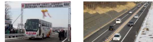
釧路外環状道路（釧路東IC～釧路別保IC） 釧路中標津道路（一般国道272号）上別保道路開通 （平成31年3月）

道東道等の延伸が進み、道央圏や外国人旅行者の主要な玄関口である新千歳空港と釧路・根室地域とのアクセス性が向上