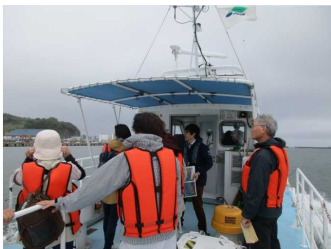
小樽の歴史北海道の経済を支えた「小樽港」と鉄道「手宮線」の歴史をたどるツアー