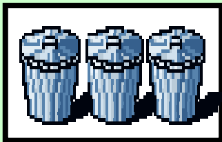
一般廃棄物の海面処分比率(全国)の推移