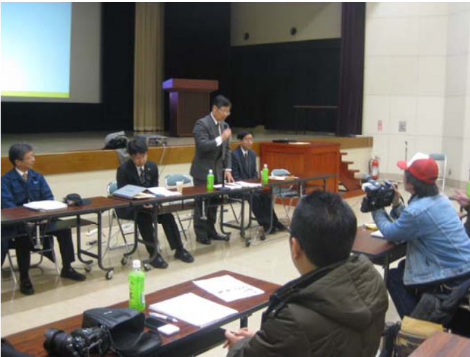
説明会場風景(前年度風景)