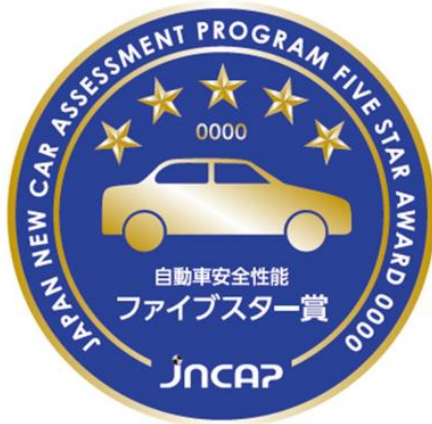
図. 自動車安全性能 ファイブスター賞 エンブレム