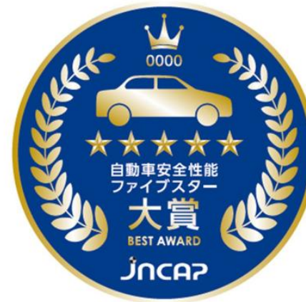
図. 自動車安全性能 ファイブスター大賞 エンブレム（現行）