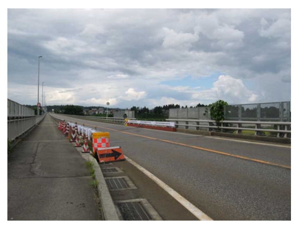
写真 1 デリネーターに接触して歩道に侵入 写真 2 横転して対向車線上の防雪ネットに衝突