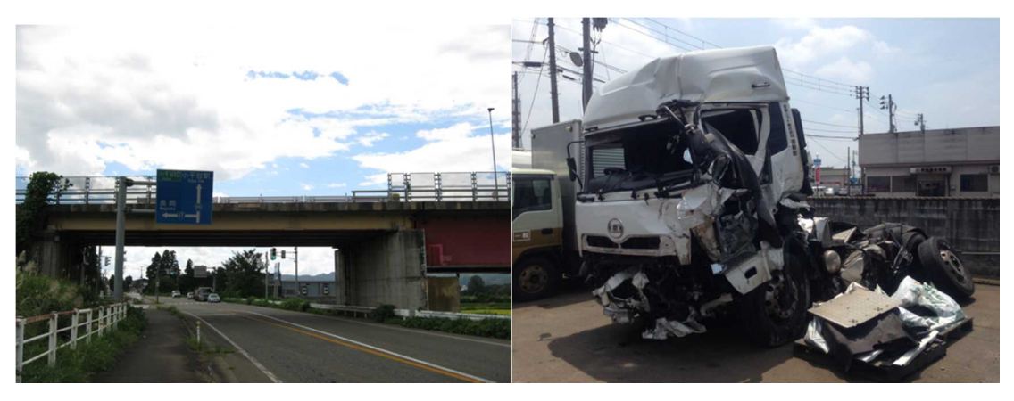
写真3 当該運転者が車外放出で転落した道路 写真4 横転破損したトラクタの左側状況