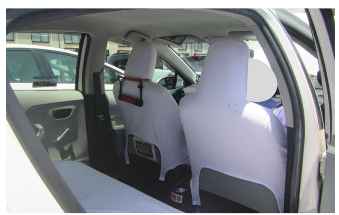
写真 2 車室内