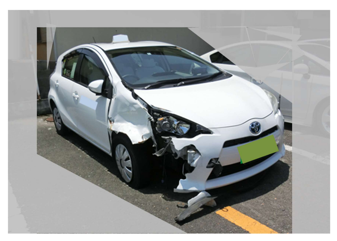
写真 1 当該車両