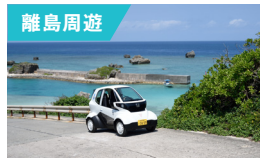
潮風と波音が快適