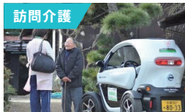
庭先まで乗り入れ駐車が楽々