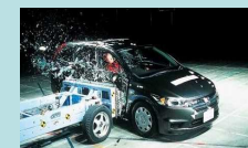
自動車安全性能の評価