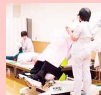
在宅療養中のリハビリ支援