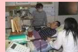
介護料の支給・訪問支援