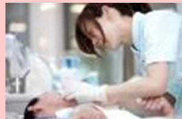
療護施設の設置・運営