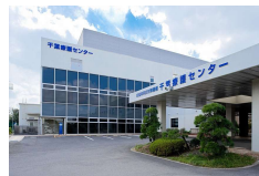
老朽化の進む千葉療護センター(築38年)

遷延性意識障害からの治療改善にさらに取り組むとともに、老朽化や感染症への対策を講じることで安心できる環境整備を推進