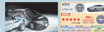
自動車安全性能の評価

一般会計からの繰戻しを前提として、「被害者支援」・「事故防止」を持続的に実施できる仕組みへの転換が必要