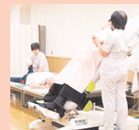
在宅療養中のリハビリ支援