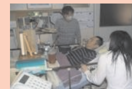
介護料の支給・訪問支援