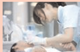
療護施設の設置・運営