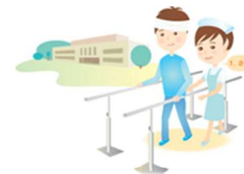
(例) 治療・リハビリ機会の提供