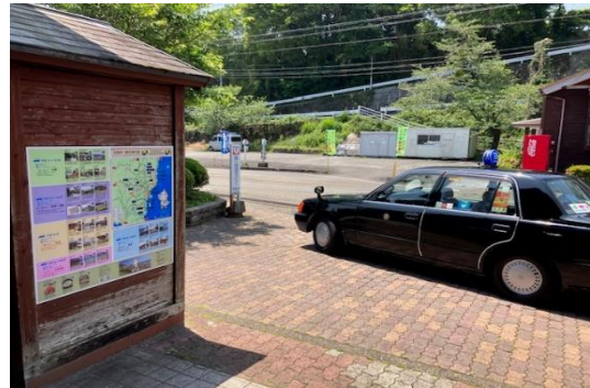
※乗務員が行っている名所案内の看板（駅ホームに設置）及び観光案内看板