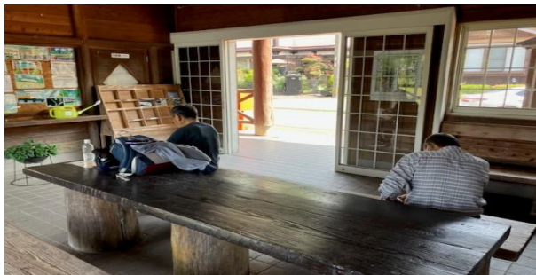
サイクリング者とウォーキング者の休憩風景