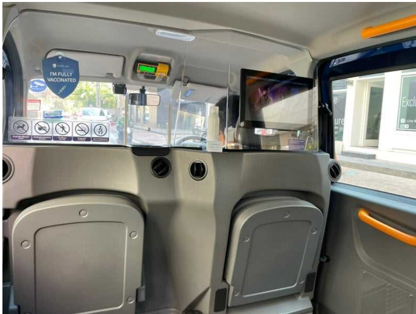
ahahana様 ブログからの引用