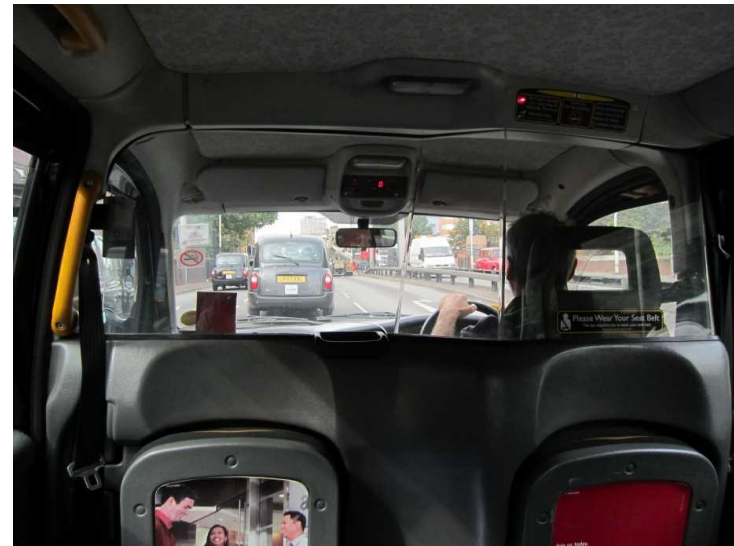
SAKEDORIりゅうたに@射命丸様 ホームページからの引用