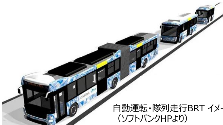
自動運転・隊列走行BRT イメージ (ソフトバンクHPより)