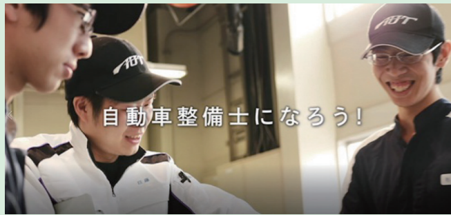
【整備士学校に通う学生の声】