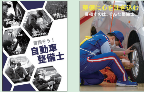
令和4年度最優秀作品