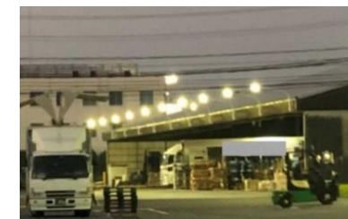
トラックターミナル