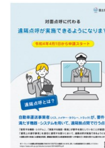
(参考)遠隔点呼制度化時作成のリーフレット

→調査で得られた現行制度の困りごとや課題についてもニーズを踏まえながら随時対応していく