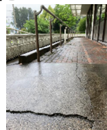
散歩コースの沈下

R7年度に築41年(病院の耐用年数は40年)を迎えるところ、顕著化してきている経年劣化への対応が必須