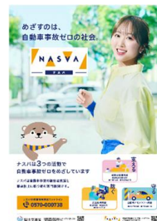
(ナスバ新ポスター)

警察や医療機関等の関係機関と連携した取組みを継続しつつ、令和7年度に作成した新たなナスバ紹介動画を各種広告媒体やイベント等で活用し、ナスバ認知度向上に資する取組みを実施