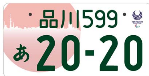
(東京2020パラリンピックエンブレム入り (イメージ))