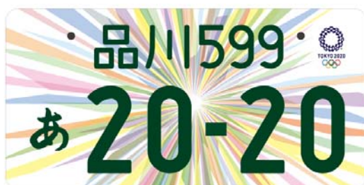
(東京2020オリンピックエンブレム入り (イメージ))