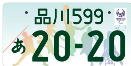
(東京2020パラリンピックエンブレム入り (イメージ))