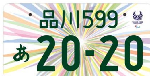
(東京2020パラリンピックエンブレム入り (イメージ))