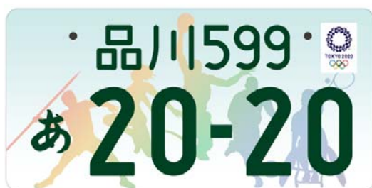
(東京2020オリンピックエンブレム入り (イメージ))