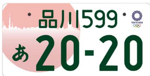
(東京2020オリンピックエンブレム入り (イメージ))