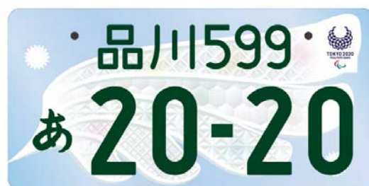
(東京2020パラリンピックエンブレム入り (イメージ))