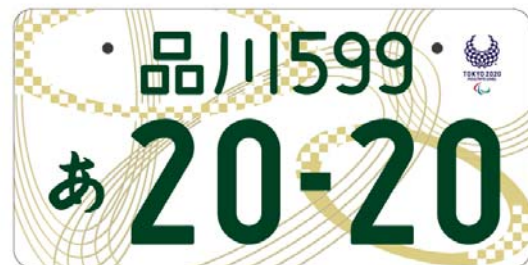
(東京2020パラリンピックエンブレム入り (イメージ))