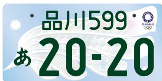
(東京2020オリンピックエンブレム入り (イメージ))