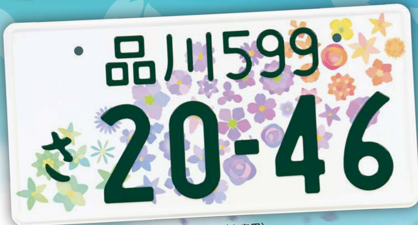
登録自動車(自家用)