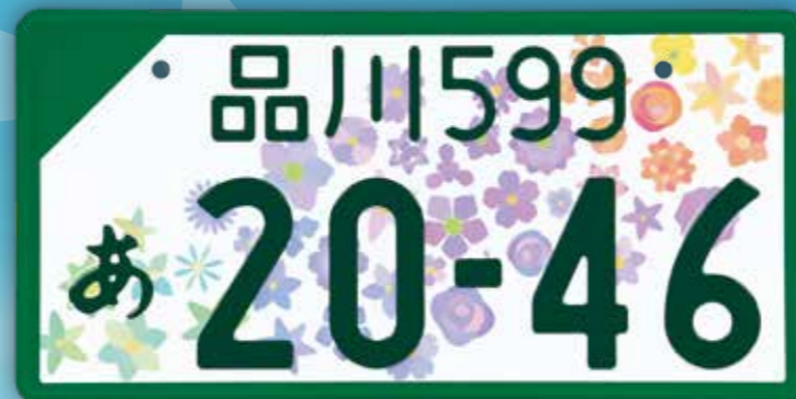
登録自動車(事業用)