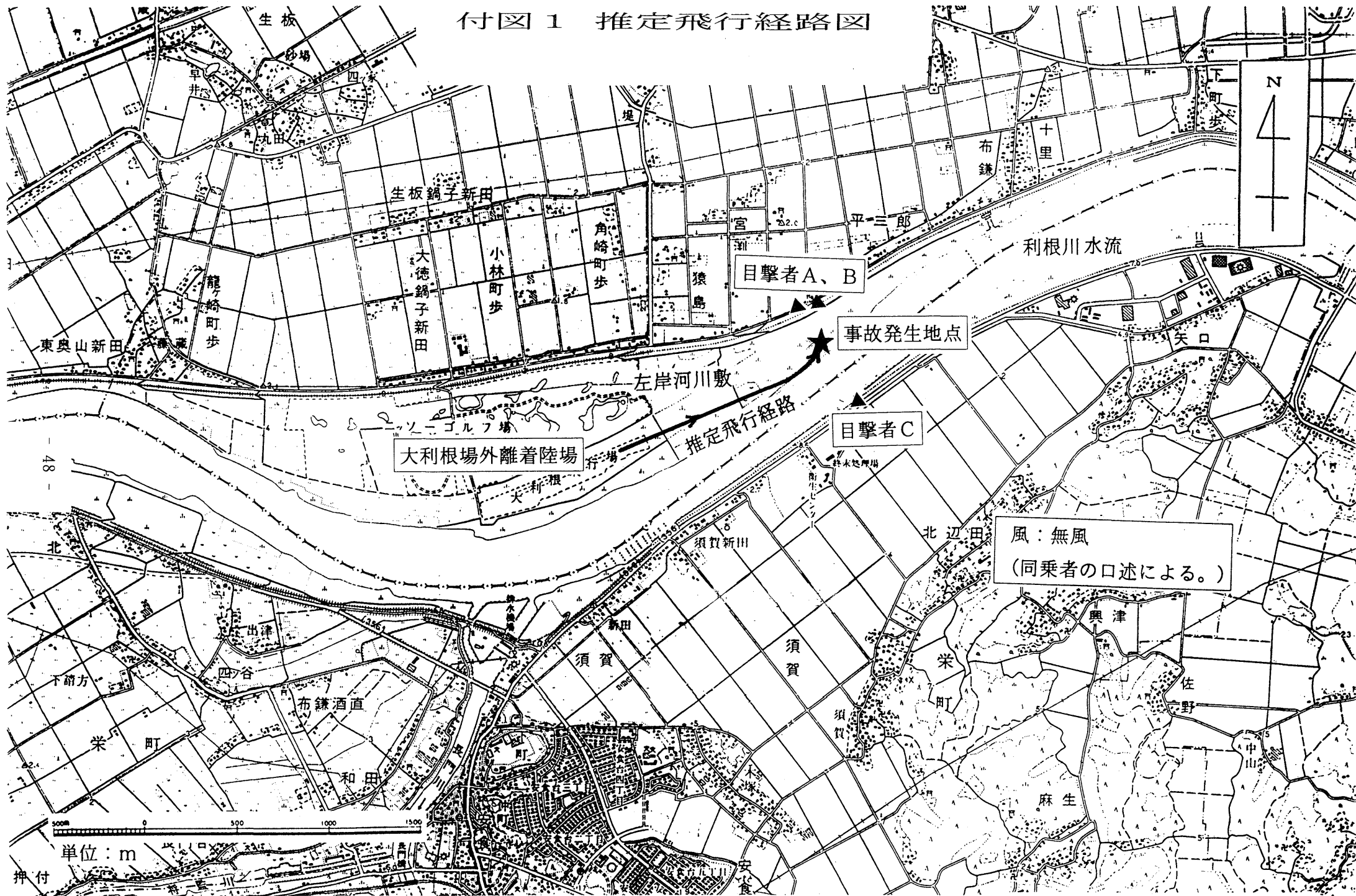
付図1 推定飛行経路図