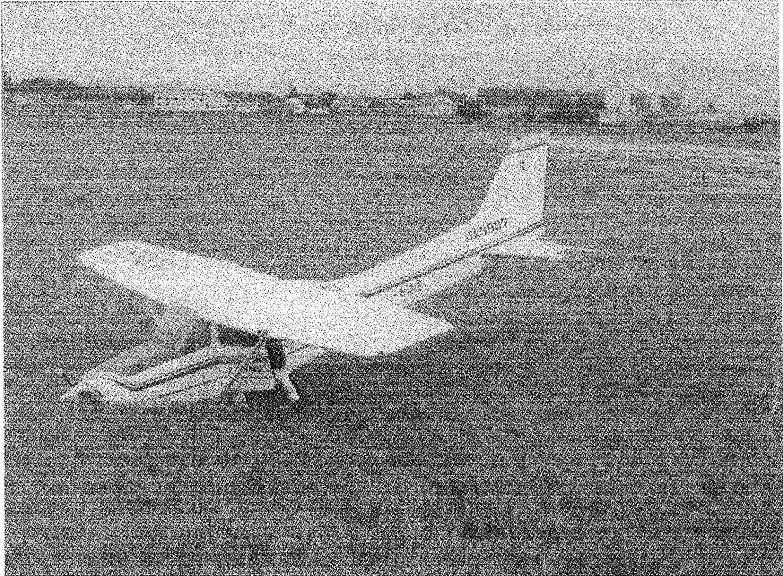
写真 2 事故機（機首部下面）