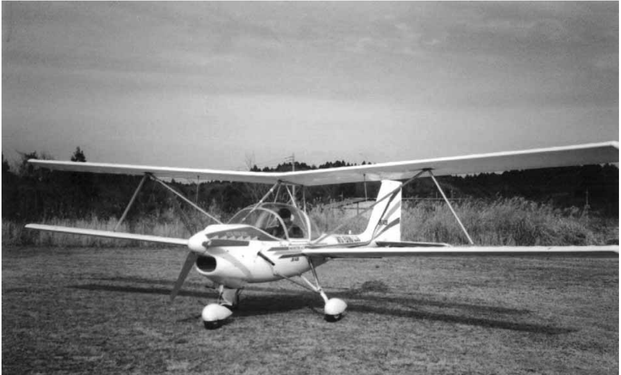
写真 1 事故機（事故前の撮影）