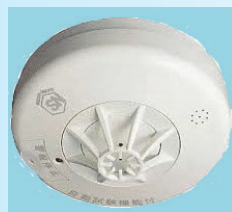
火災探知装置(熱式)

特に、機関室が無人になる漁船については、これらの対策が被害の軽減に役立つので、実施を検討しましょう！