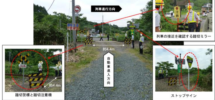
写真2 踏切周辺の状況