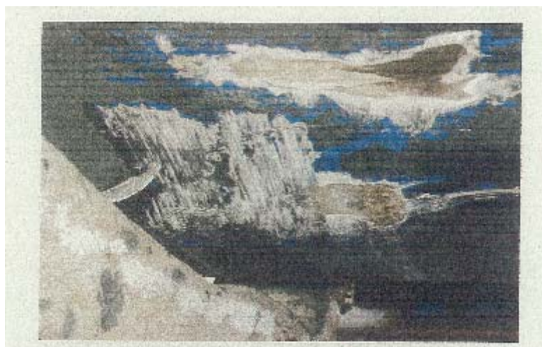
写真2 左舷船尾船底部の損傷状況