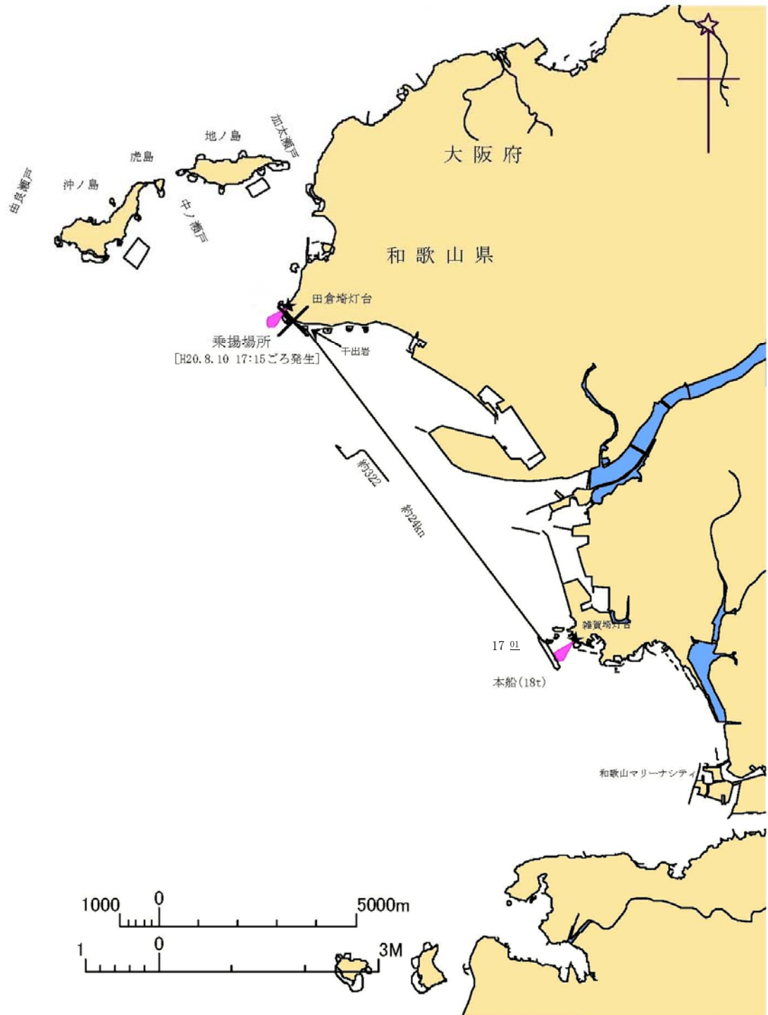
付図1 推定航行経路概略図