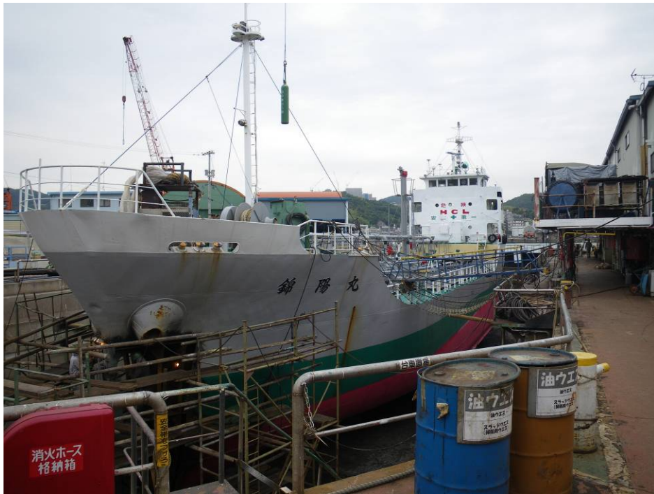
写真2 A船の損傷状況②