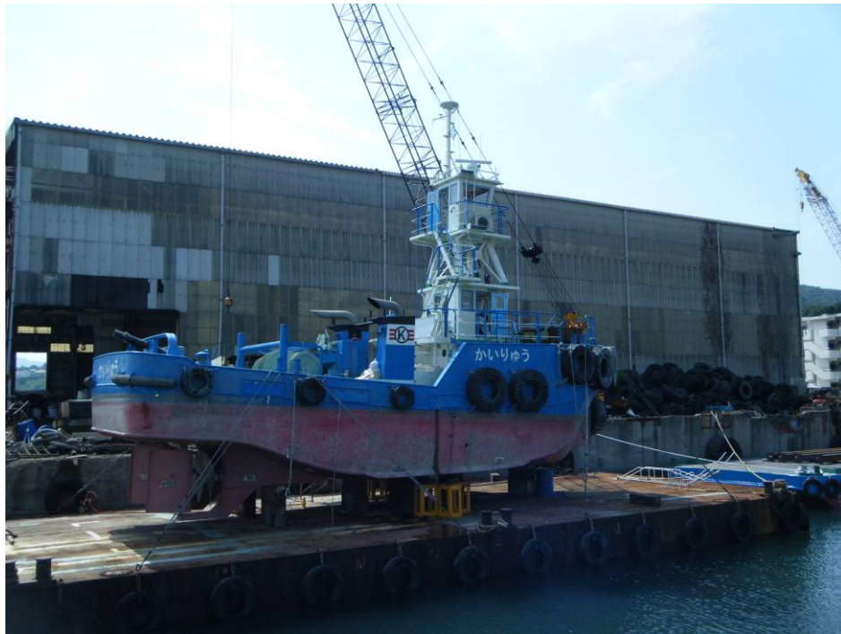
写真4 本件台船の損傷状況（左舷船首部）