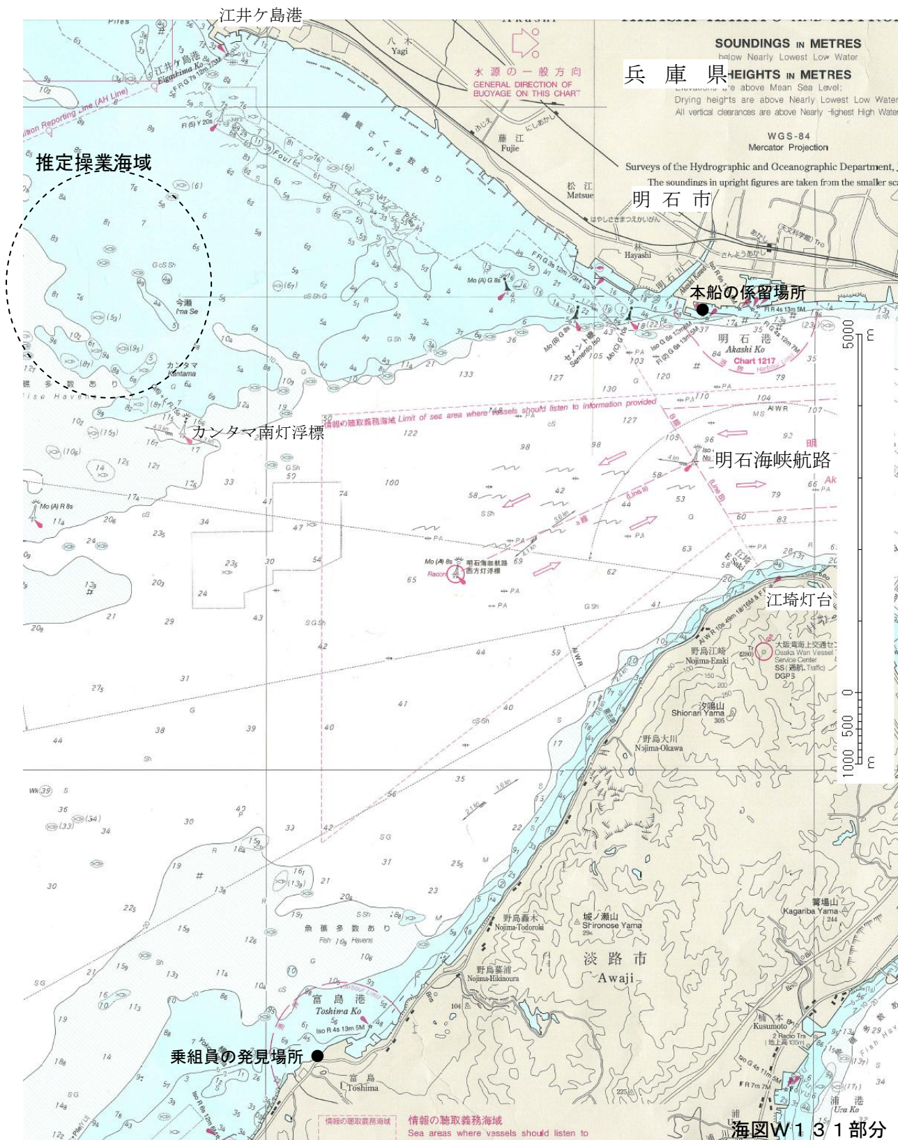
付図1 推定操業海域及び乗組員発見場所図