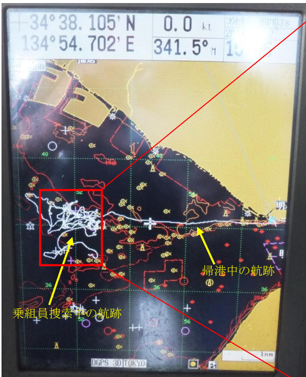
写真2 GPSプロッターに表示された航跡(1)