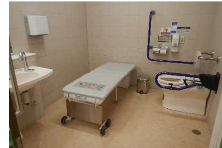
折り畳み式大型ベッドのある便房