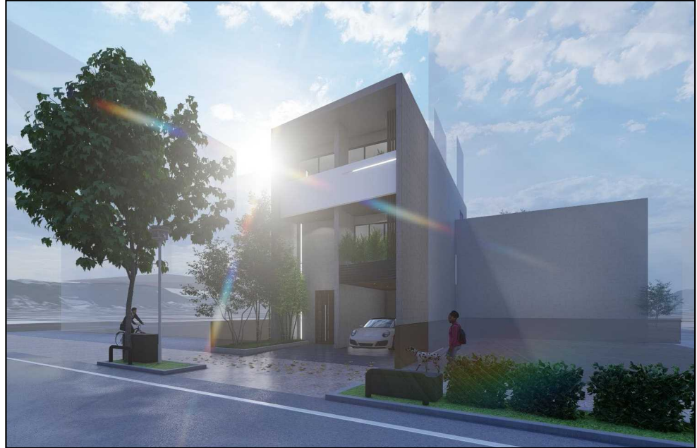
△建築主に対する初期提案イメージ

鹿児島県の建築関連企業におけるBIMの導入率は高いとは言えません。本県において特にBIM活用実績が豊富な設計事務所と建設会社を中心となり、県内企業間によるBIM連携の課題の洗い出しと最適化を目指します。