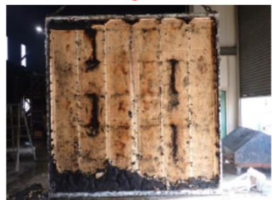
試験後解体した写真（内部の状況）