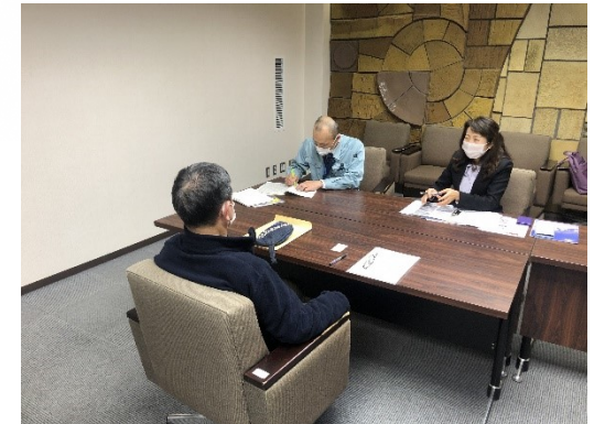
(相談者、担当事業者、金沢市との三者面談)