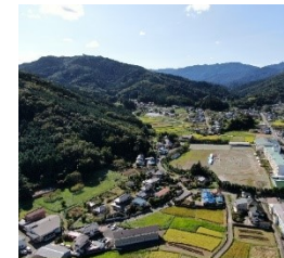
ときがわ町 移住相談マニュアル