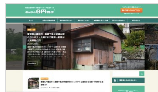
マッチングサイト「みんなの0円物件」掲載