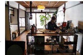
オフィス活用事例