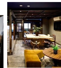
コワーキングスペース活用事例