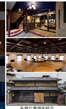
多様な事例を紹介