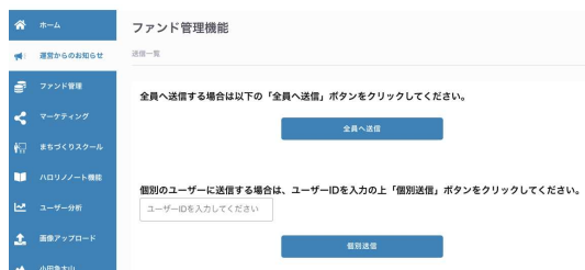
投資家とのコミュニケーション機能管理画面

【成果1】不動産特定共同事業者(小規模含む)向けのプラットフォーム機能を拡充し、取り組みの対外発信/投資家とのコミュニケーション機能/ファンド組成情報入力・書面作成サポート/小規模不特定共同事業者向け募集総額及び投資額上限設定/外部事業者アクセス用のサーバー構築を実施した。 【成果2】不動産特定共同事業者(小規模含む)がプラットフォームを活用し、クラウドファンディングで投資を募集する際の、必要業務一覧/進捗確認表/各業務に対するマニュアルを作成した。