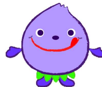
小平市マスコットキャラクター 「ぶるべー」