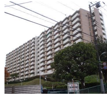
赤枠内：上高田四丁目団地