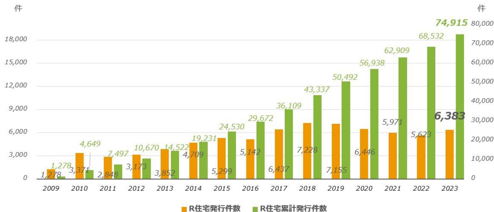
『R住宅』発行件数推移