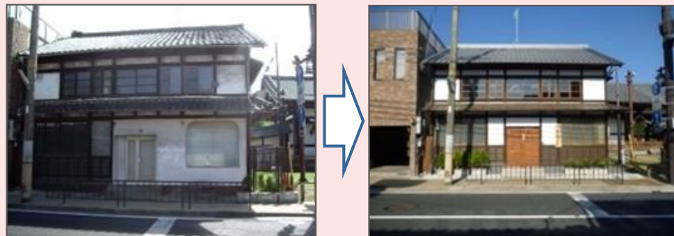
地域活性化のため、空き家を活用し観光交流施設を整備